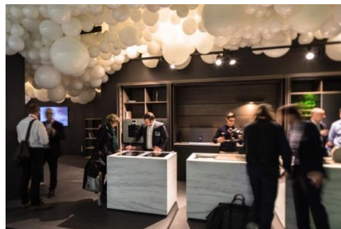
La présentation spéciale Tendance Cuisine proposait de nouveaux concepts pour un temple de la gastronomie très personnel.