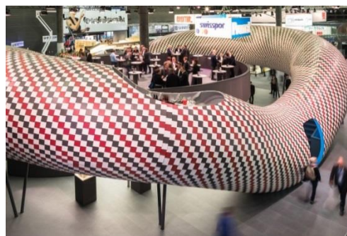
L'étonnante architecture du stand Eternit, Promat et swisspor dans la halle Gros œuvre et Enveloppe du bâtiment