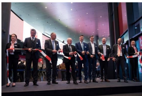
Le mardi 16 janvier, le conseiller fédéral Ueli Maurer inaugure Swissbau 2018.

Résumé en vidéo de Swissbau 2018: Youtube Swissbau