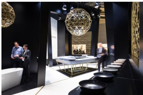
De matériaux de qualité et des concepts d'aménagement sophistiqués ont plongé les visiteurs dans un univers de découvertes sensorielles.