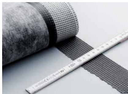
Standarddüse für optimale Schweissnahtbreite