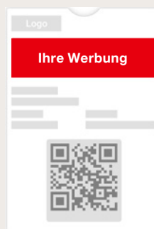
Abb. 3: Wallet