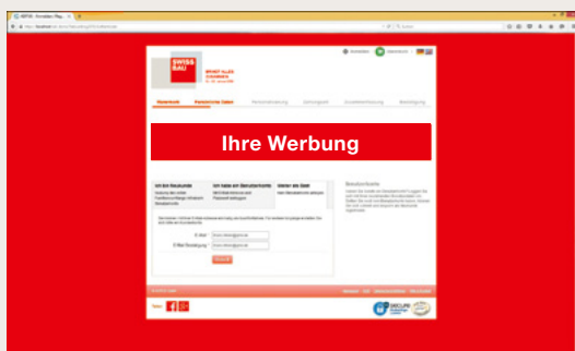
Abb. 1: Ticket-Shop