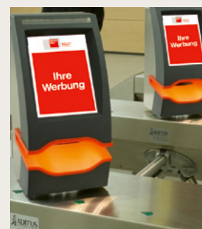
Abb. 4: Drehkreuz