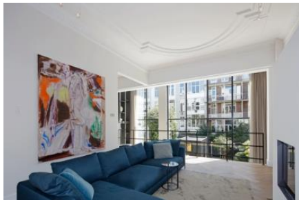
forster unico XS sorgt für viel Licht und Transparenz Wohnhaus in Amsterdam, Niederlande (03_16_12_16_A5)

Die Profile aus 100% Stahl ohne zusätzliche Kunststoffisolatoren sind besonders langlebig, ökologisch und nachhaltig und können zu hundert Prozent recycelt werden.