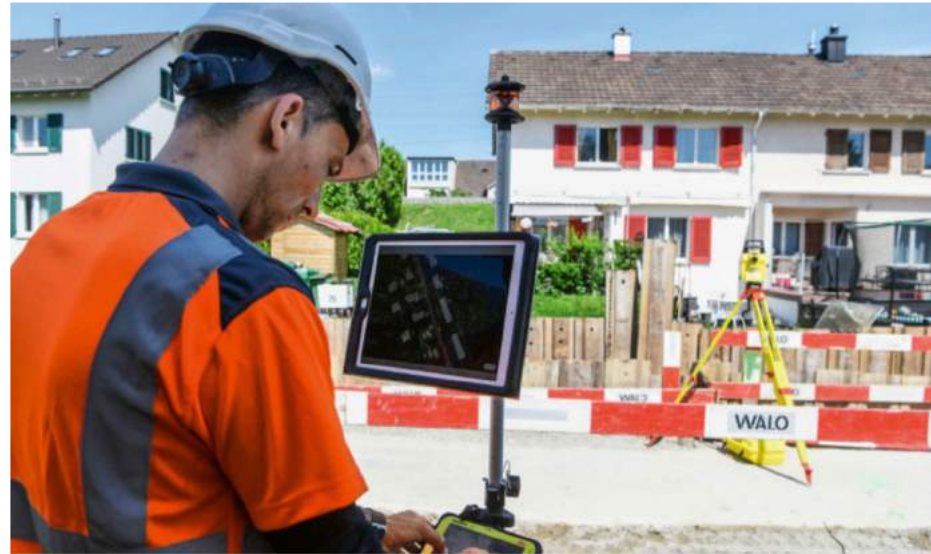
Die «gläserne» Baustelle ermöglicht auch ein gutes Ressourcenmanagement.