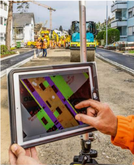
Dank digitalen Baustellen werden Gemeindeverwalter Kosten sparen: Der «digitale Zwilling» bildet genau ab, was sich unter der Strassenoberfläche befindet.