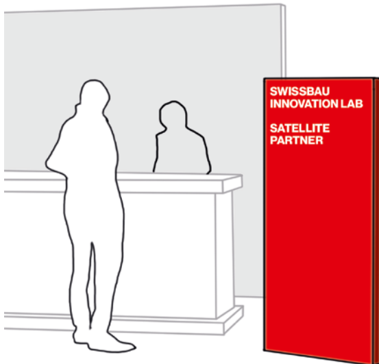
Infopoint am Stand